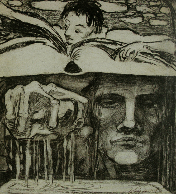
Ernst Barlach, Symbol der Erkenntnis, um 1905